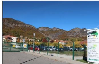
Depuis le début du mois, une trentaine de personnes parmi les résidents et le personnel a contracté le coronavirus.