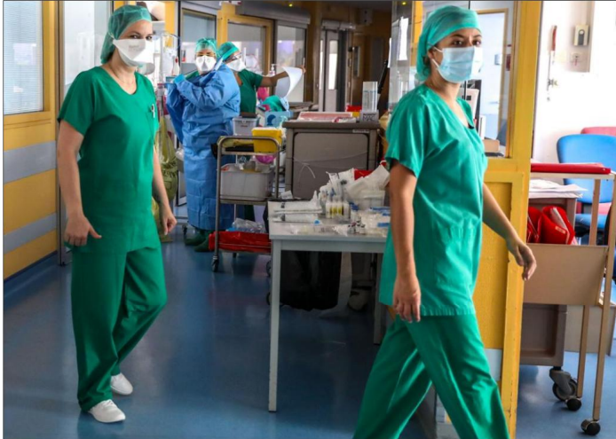
L'épidémie marque une reprise soutenue dans les Hautes-Alpes, passées en "vulnérabilité élevée" le 4 octobre. Le Plan blanc a été déclenché dans les hôpitaux haut-alpins le 9. Et les établissements appliquent désormais de nouvelles mesures pour faire face.

Ce mardi 27 octobre, de nouvelles mesures prises par les hôpitaux ont été annoncées par leurs directeurs. Un maximum de lits de réanimation