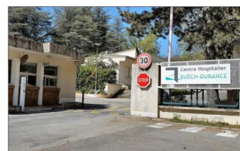
Les agents du centre hospitalier Buëch-Durance, du FAM Les 4 saisons et de la MAS Soleil Ame ont co-signé un courrier adressé au président. Un appel à la grève illimitée est lancé à partir de ce mercredi 28 octobre.

Au-delà de l'appel à la grève illimitée, la CGT appelle tous les personnels du privé, du public et de l'associatif à